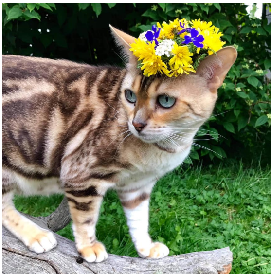
Midsommarfina bengalen Sofia

Gratis för BJK-medlemmar, 50 kr för övriga. 50 anmälda, varav 29 icke medlemmar. Under Zoommötet var som flest 44 på plats.