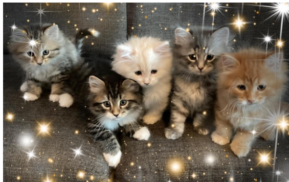
SE*Leannain's sibirisk katt

Kattens Dag firades därför under enklare former i fb-gruppen Björkstakatter där medlemmar uppmuntrades att visa bilder på älskade katter och berättade om deras stora betydelse som familjemedlemmar.