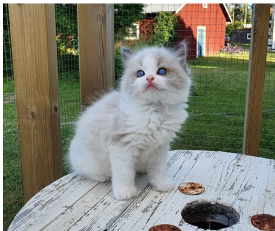
SE*TillyTrotter's Feel4U Taddeo, RAG foto Carina Ohlsson

Söndag 21 februari kl 14 hölls klubbens årsmöte, detta år via Zoom och med 20 deltagare. Bokslutet godkändes och styrelsen beviljades ansvarsfrihet. Styrelsen valdes om, inga motioner eller andra ärenden.