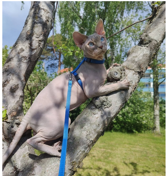
Gulliver, sphynx

Från hösten infördes en anmälningsavgift på 100 kr/katt för medlemmar och 200 kr/katt för övriga. Den betalas i förväg och utöver Nilsfors egen undersökningsavgift. När det blir fullbokat har BJKs medlemmar förtur.