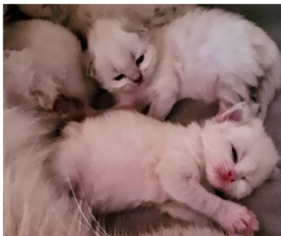
SE*Odenkatten's neva masquerade, uppf Krista Rousu