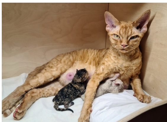
S*Lovling Nest devon rex, uppf Katja Löfling