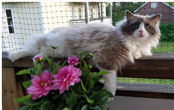
N*Aakres Ragpride Permarie "Gutta"

samtliga FIFes internationella utställningar, rabatt på kattförsäkring hos Agria, på samtliga SCANDIC-hotell i Sverige samt rabatt på LANGFORDS gentester.