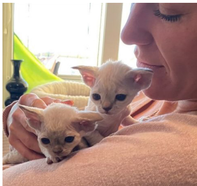
Devon rexungarna SE*Lovling Nest III Belle och III Rachele. Uppfödare Katja Löfving.