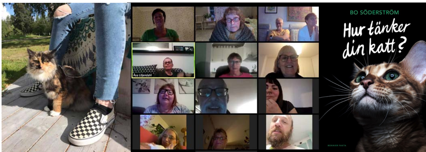
Sibiriska katten Miss Charmine med matte på kattpicknick - Upptastsmöte via zoom - Kursbok i cirkeln "Förstå din katt".