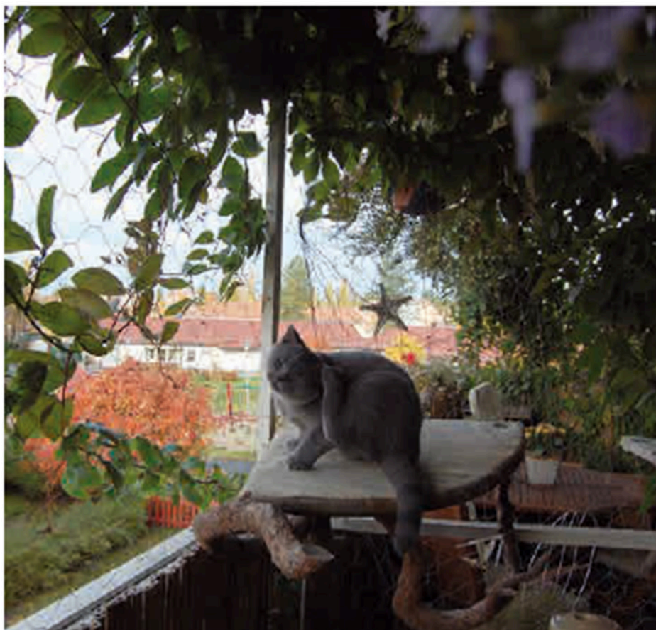
Balkongnät förhindrar att katter ramlar ner och skadar sig – och är enligt lag obligatoriskt om balkongen är mer än fem meter över marken.