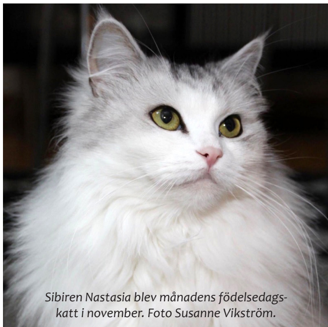
Sibiren Nastasia blev månadens födelsedagskatt i november.

Den 10 juni samlades 28 vuxna och 2 barn till traditionell vårfest. Det blev grillbuffé, potatisgratäng och grekisk potatissallad med kladdkaka till efterrätt.