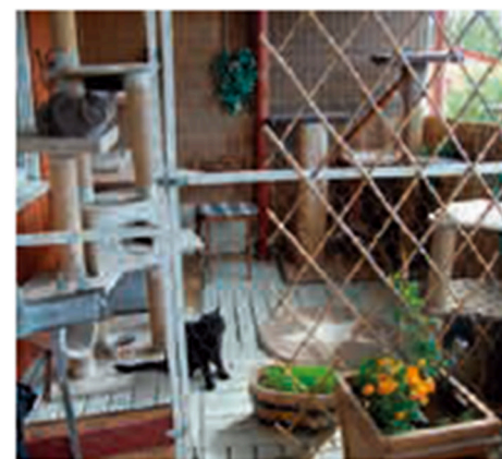
Klätterträd och utläsplatser är uppskattade inslag även på uteplatsen.