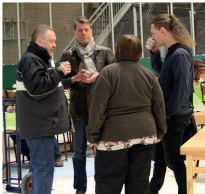
Utställningsbyggare som tar en välbehövlig paus.