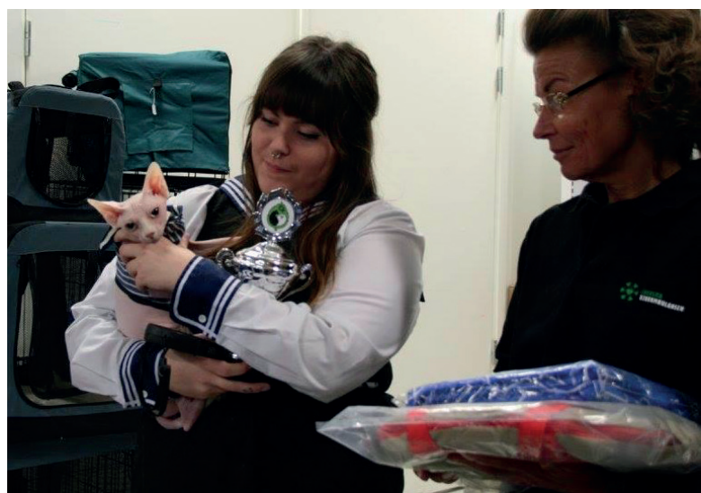
Årets Look alike i matchande klädsel.