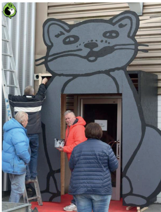
Den tjugiga entrékatten som välkomnade alla utställare och besökare.